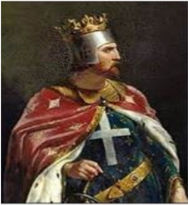
Richard Cœur de Lion ; roi d'Angleterre -

Il ne parlait pas anglais ; ses origines sont doublement françaises , de sa mère Aliénor d' Aquitaine et de son père Henri II Plantagenêt ; élevé dans le sud-ouest en France il parle le latin et le français . En dix ans de règne , il ne séjourna que six mois en Angleterre .