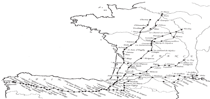
FIGURE 28-1 Map of the pilgrimage routes to Santiago de Compostela. From Annie Shaver-Crandell, Paula Gerson, and Alison Stones, The Pilgrim's Guide to Santiago de Compostela: A Gazetteer (London, 1995).

Pour ceux qui auraient encore des doutes sur les capacités des hommes du Moyen-Age le château de Mehun sur Yèvre avant que l' ardeur révolutionnaire ne le réduise à deux tours en ruines